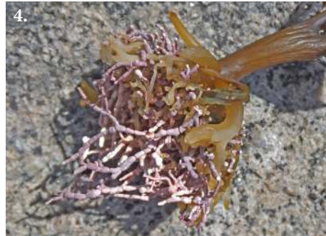
3. Кораллина шариконосная Corallina pilulifera

Растение известковое, перисто разветвленное, образующее густые дернины. Цвет зеленовато-пурпурный или розовато-фиолетовый, до мраморно-белого. Высота до 5 см.