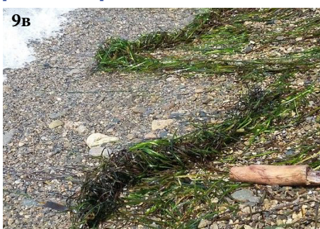
Зостера морская, морская пшеница Zostera marina

9а - колос, 9б - заросли, 9в - выбросы на берегу