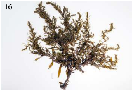
Саргассум бледный Sargassum pallidum

1а - фрагмент таллома, 1б - целый таллом