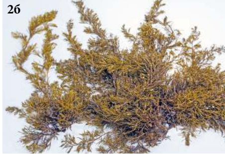
Цистозира толстоногая Stephanocystis (Cystoseira) crassipes