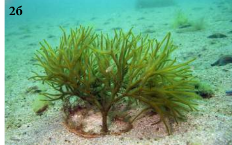
Кодиум йезоенский Codium yezoense

2a - таллом 26 - таллом на раковине моллюска