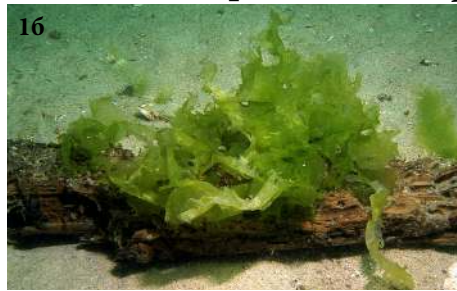
Ульва латук Морской салат Ulva lactuca

1a - таллом 16 - таллом на старом дереве Слоевище пластинчатое, неправильной формы, ровное или волнистое по краям, перфорированное. Цвет зелёный. Длина от нескольких см до 1 м, ширина до 20 см. Растёт на разных грунтах на мелководье до 20 м.