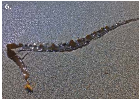
5. Фукус исчезающий Fucus evanescens

Слоевище кустистое, ветви плоские с отчетливым ребром, высотой до 25 см. На верхушках образуются раздвоенные пузыри. Растёт на каменистых грунтах на глубине до 1 м.