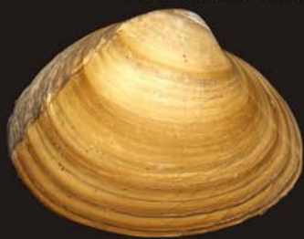
3. Spisula sachalinensis – спизула сахалинская