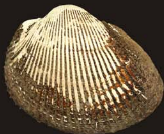
1. Anadara broughtonii – анадара Брутона