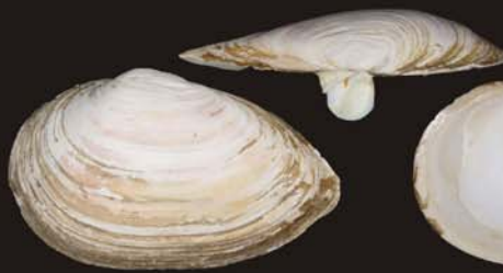
6. Mya japonica – мия японская