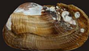
7. Entodesma navicula – энтодесма