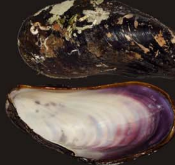
3. Modiolus kurilensis – модиолус курильский