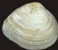
10. Macoma irus – макома желтоватая