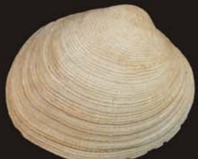
8. Protothaca euglypta – прототака мелкосетчатая