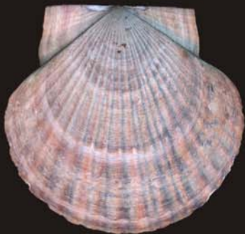
4. Mizuhopecten yessoensis – приморский гребешок