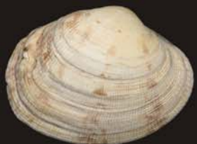
9. Ruditapes philippinarum – рудитапес филиппинский