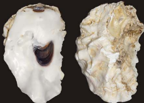
6. Crassostrea gigas – гигантская