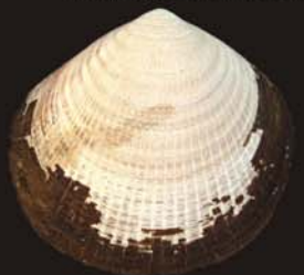
5. Glycymeris yessoensis – глицимерис хоккайдский