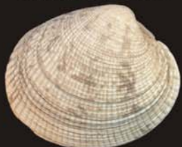
7. Protothaca jedoensis – прототака токийская (крупносетчатая)