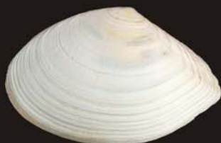
9. Megangulus venulosus – мегангулус жилковатый