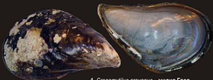
1. Crenomytilus grayanus – мидия Грзя