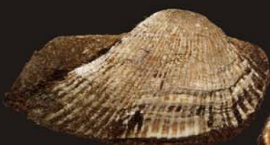
2. Arca boucardi – арка Боукарда