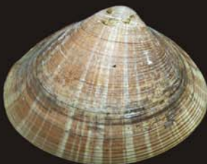
4. Mactra chinensis – мактра китайская (полосатая)