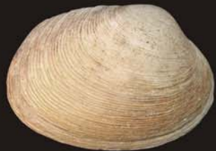
10. Saxidomus purpuratus – саксидомус пурпурный