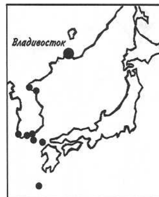
Места зимовок уссурийских бакланов, окольцованных под Владивостоком

На Дальнем Востоке есть и другие бакланы. Берингов баклан отличается от уссурийского меньшими размерами и более изящными формами. На Курильских островах живет еще один некрупный баклан - краснолицый. Кроме того, на речных островах Усури, Амура и их притоков можно встретить колонии большого баклана. По размеру и окраске он очень похож на уссурийского, но, в отличие от него, связан преимущественно с пресными водами. Известно лишь одно место в Приморье, где эти бакланы устроили свое гнездовье на морском побережье. Это - мелкие острова Дальневосточного морского заповедника. Здесь же находится колония уссурийского баклана - одно из самых крупных в мире гнездовий этого вида. Кстати, на территории заповедника гнездятся сразу три вида бакланов - уссурийский, берингов и большой.